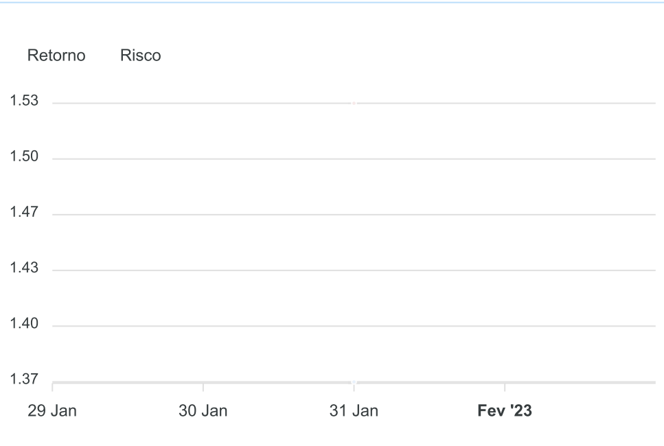
Gráfico Risco x Retorno